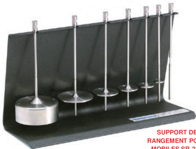
SUPPORT DE RANGEMENT POUR MOBILES SR-23Y

Le jeu de mobiles RV/HA/HB contient les mobiles #2 à #7 et est fourni avec les viscosimètres et rhéomètres Brookfield standard.